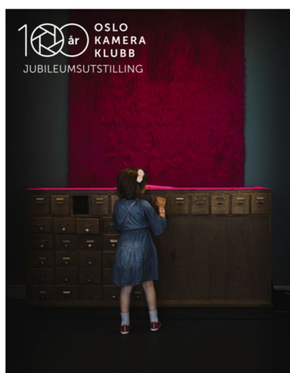
Pilestredet 75c, inngang 23.

Det ble altså en kuratert utstilling – hvor den enkelte i gruppen valgte ut bilder fra katalogene til Preus og NSFF, printet ut, og tok med til fellessamlinger hvor vi diskuterte oss fram til hvilke fotografier som skulle med og ikke. Kriteriene for utvelgelsen var kronologi, estetikk (hvilke bilder passer inn) og representasjon (at tidligere medlemmer som hadde vunnet mye, måtte med). Etter mange diskusjonsrunder, satt vi igjen med ca. 200 bilder som vi printet ut i stort format og hang rett på vegg i kronologisk rekkefølge. Vegger vi enten selv hadde malt, eller snekret sammen. Vi satte nemlig opp en lettvegg på ca. 10 meter midt i lokalet for å få plass til flere bilder, samt gjøre det hyggeligere i lokalet.