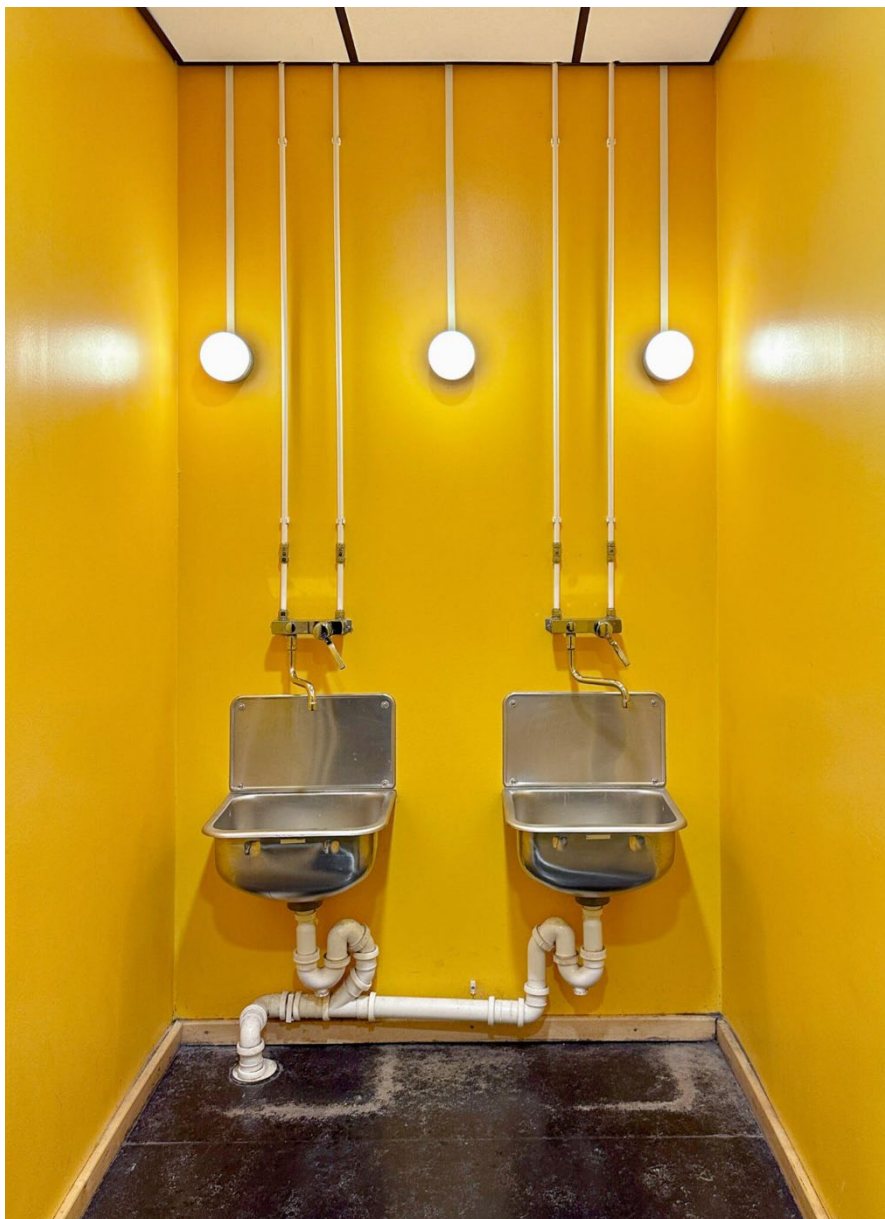
Tema Repetisjon , 1. plass i Ukens bilde 4. desember 2023